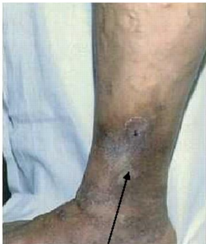
Hyperpigmentation Venous ulcer